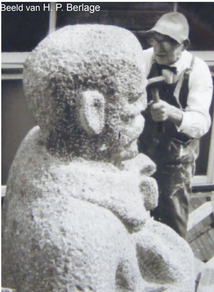
Beeld van H. P. Berlage